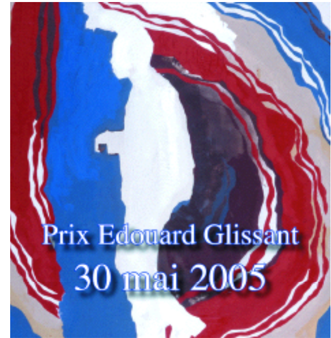
Illustration : peinture de Maurice Matieu.